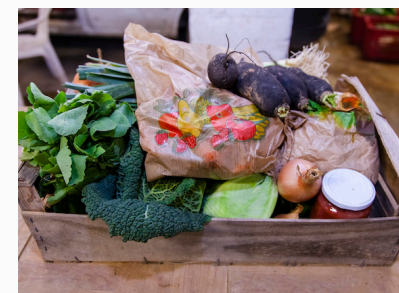
Le panier de légumes

En adhérent à l'AMAP Croquevert, vous pourrez accéder à d'autres contrats liés aux saisons, avec des producteurs en agriculture biologique et dans une exploitation locale et paysanne (miel, pommes, confiture, sorbets, raisins, fromage...)