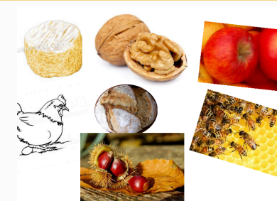
Des contrats variés